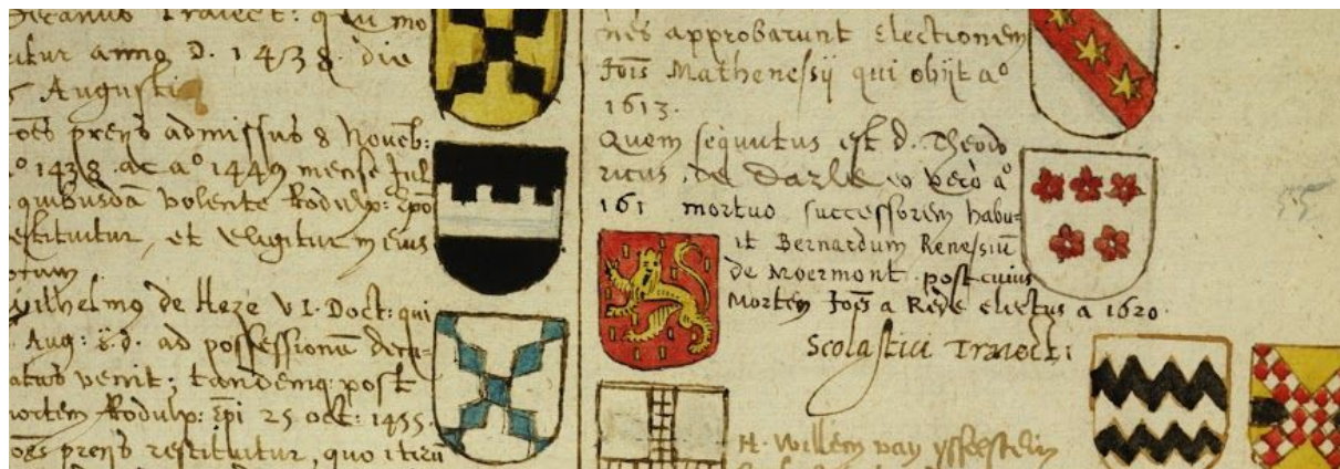
Het wapen van Proeys (tweede van links) in zwart uitgevoerd met een gekanteelde zilveren dwarsbalk. Fragment uit Aernout van Buchels Monumenta (f55). Circa 1620.

Wat de archieven wel vertellen is dat de pachtsom die Arnoud moet betalen voor een deel uit geld bestaat en voor een ander deel uit natura in de vorm van honderd kippen. In 1335 komt hij in aanvaring met het Domkapittel omdat hij de kippen nog niet heeft betaald 38 . Het komt hem duur te staan, want in 1336 ontnemt het kapittel Arnoud het recht op Oostveen omdat hij zijn schulden niet heeft betaald 39 . Het was in het Sticht goed mogelijk dat ministerialen deel uit gingen maken van het stadspatriciaat 40 en dat gebeurt ook. Arnoud schopt het tot burgemeester van Utrecht in 1326 en 1331. En schepen in 1337. Ook is bekend dat hij een huis bezit dat de naam 'Boventorp' draagt, gelegen tussen de stadsmuur en de Lauwerstraat 41 .