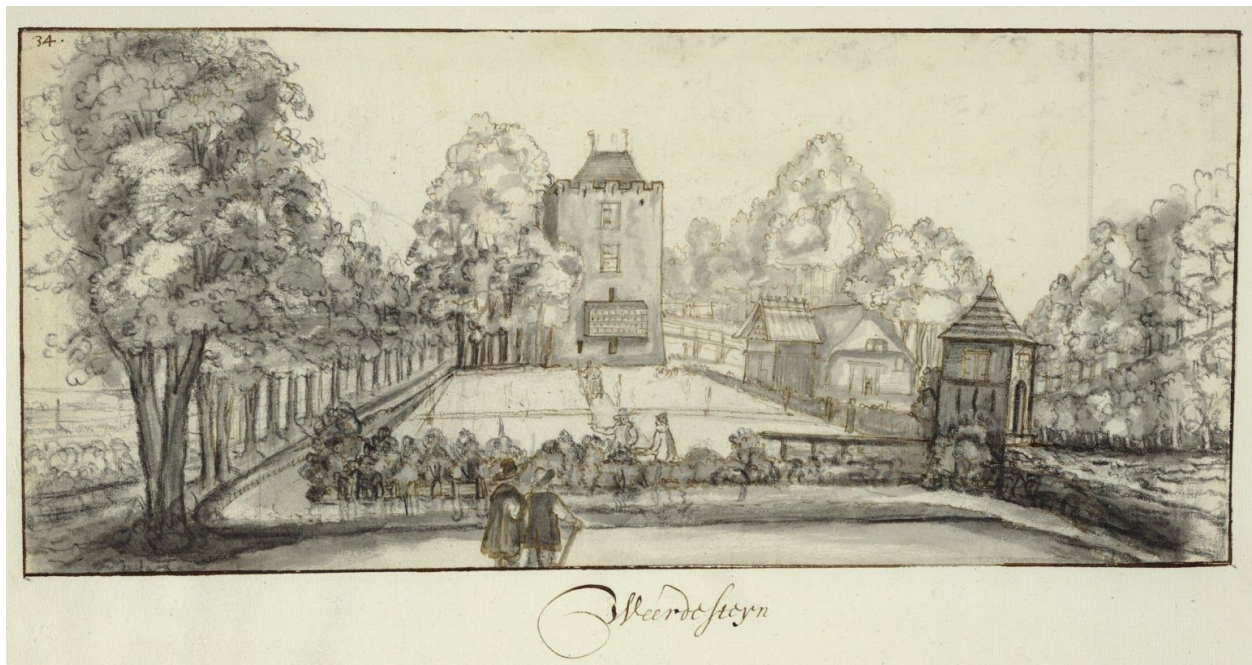
De woontoren van kasteel Weerdesteijn te Langbroek met rechts het poortgebouw en daarachter de boerderij met duiventoren. Cat. nummer 135441. Circa 1660-1670.

W e zagen net dat de familie van Amerongen eind dertiende eeuw een woontoren bouwt die uitgroeit tot het latere kasteel Amerongen. Het bouwen van woontorens is een fenomeen dat halverwege de dertiende eeuw opkomt. We duiken hier wat dieper in, omdat de familie Proeys hoogstwaarschijnlijk betrokken is bij de bouw van woontorens in de omgeving van Utrecht.