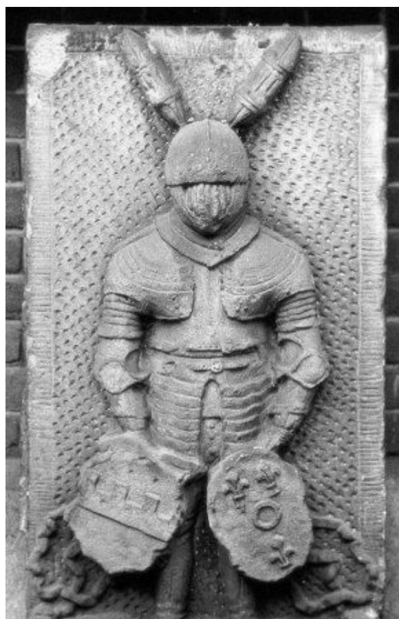
Gevelsteen met geharnaste ridder met de wapens van Proeys (links) en van Westrenen. Circa 1625.